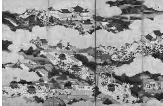
山王祭祀図屏風部分 江戸時代