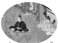
彼らは何をしている？

「香取神宮神幸祭絵巻」の絵解きをしながら、描かれた人々やお祭りの構成について、解説します。絵巻でみる神道文化！