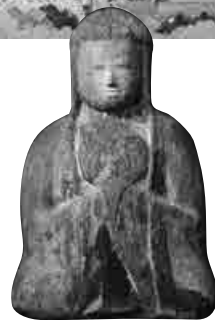
神様の姿って？ 男神像・女神像 室町時代後期