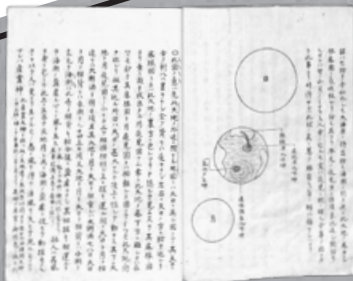
岡熊臣『大祓詞潮之八百会』 河野省三旧蔵 [國學院大學図書館蔵]