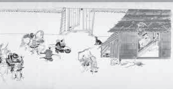
『春日権現験記絵』巻八 [國學院大學博物館蔵]