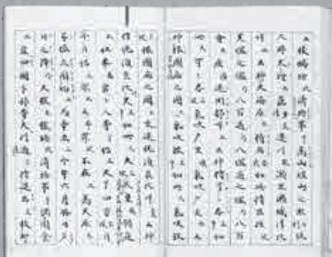
『延喜式』巻八 吉田兼右写 [國學院大學図書館蔵]