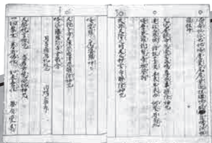
『中臣祓』(清世本) 宮地直一旧蔵 [國學院大學図書館蔵]