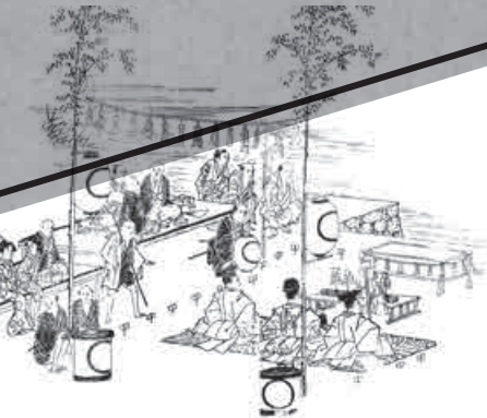
齋藤月岑『東都歳事記』 巻之三・夏部より

どのよう に形作ら れたのか、 日本の宗 教文化が どのよう に展開し てきたの かを見る ことが できます。 本展示 では、祓 の儀礼と 思想を 國學院大 學が所蔵 する様々 な資料か ら明らか にしてい きます。