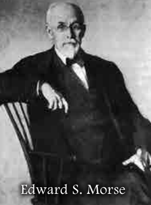
Edward S. Morse