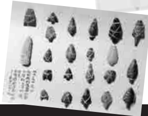
井上頼文蒐集考古資料 (國學院大學博物館蔵)