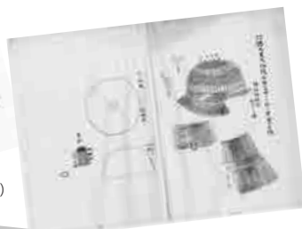
柏木政矩「仁徳天皇大仙陵石槨之中ヨリ出シ甲冑之圖」写 (國學院大學博物館蔵)