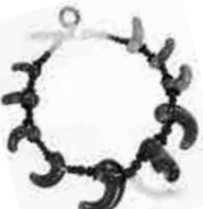
首飾り (公益財団法人 静嘉堂蔵)