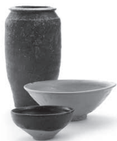
2号船出土褐釉壺・白磁碗・天目碗 松浦市教育委員会蔵