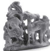
青玉製雌雄鹿像 松浦市教育委員会蔵