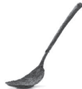
銅匙 松浦市教育委員会蔵