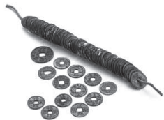
銅銭及び厭勝銭 松浦市教育委員会蔵